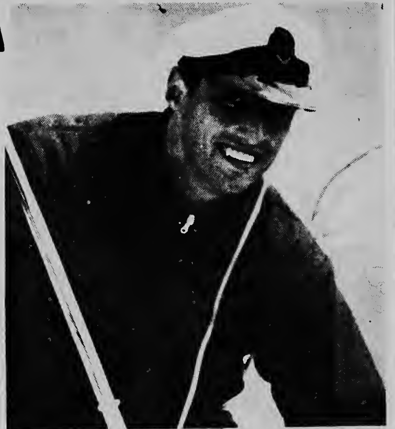
E pretendiente di trono di Noruega, principe Harald a worde eligi pa representa su pais durante weganan olympico na Tokio e anja aki den e concursionan di zeilmentu.

E aparato a dal contra di tres of cuater palu di e hoffi di appel di Walter Bashista, den e barrio aki qu ta situa oeste di Massachussets.